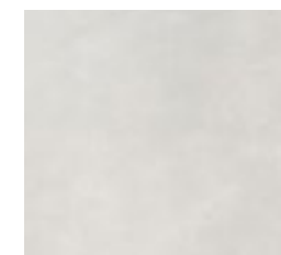
Alicatado Baño Principal